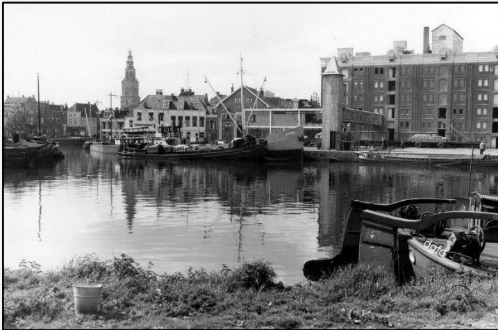
De Oosterhaven op de splitsing naar het schuitendiep

Gelukkig hebben we die traditie niet op de Zeezwaluw want de Kabola diesel kachel brandt nog volop! We kwamen bij het zoeken naar paas tradities ook nog schitterende oude zwart-wit fotos van de Oosterhaven tegen die we jullie niet willen onthouden!