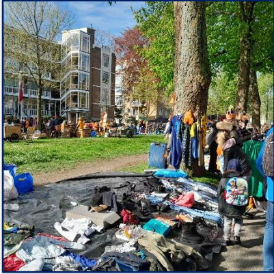
Overzicht singel Heel klein meisje verkoopt haar spulletjes