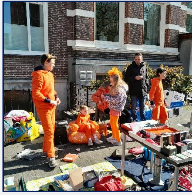
Familie oranje verkopers