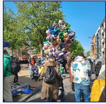
ballonnen in alle vormen mooie poppen