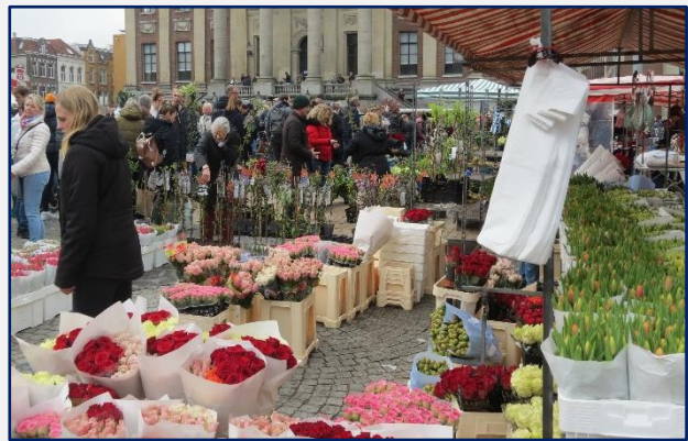
vele kleuren tulpen en rozen