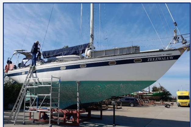
SB zijde is bijna gereed op 23 september