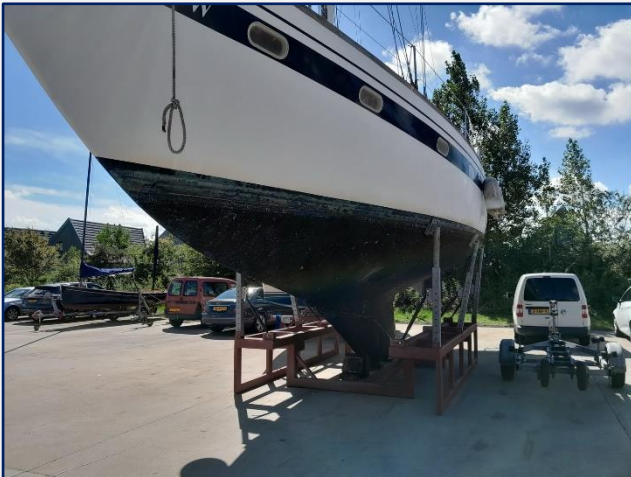
Dag 1 uit het water

Als we ongeveer halverwege AF verwijdering zijn, start Riens met schuren (met de Dremel) van de nu droge opengekrabde plekken en maakt de "pin-hole" gaatjes ruimer. Ineke gaat verder met AF krabben afgewisseld met het schuren van de laatste restjes AF van de romp (Makita schuurmachine).