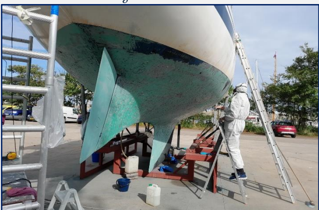
Riens in volle uitrusting aan het dremelen