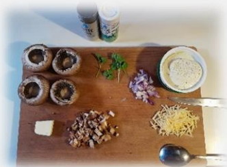
Ingrediënten en gevulde champignons