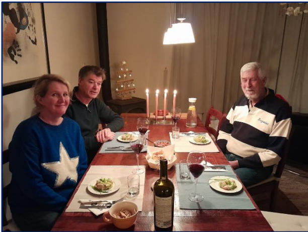
Een samengesteld 2 de kerstdag