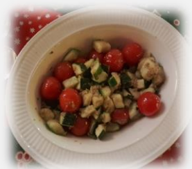
Fazant en salade

Het menu 1 ste Kerstdag bestond uit; gevulde kastanje paddenstoelen, gevolgd door fazantfilet gerold in spek, aardappelkroketjes en courgette met tapenade en broccoli. Als nagerecht Irish koffie met pralines. Wat hebben we hier heerlijk van genoten, alles smaakte voortreffelijk.