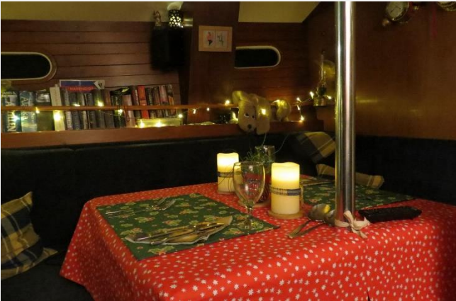
Feestelijk gedekte tafel

Nog even terug naar het laatste stukje december. De eerste kerstdag zijn we samen aanboord gebleven en hebben ons kerstdiner heerlijk rustig aan eigen versierde tafel genoten. Het menu bestond uit allemaal nieuwe gerechten. Spannend, want stel dat het mislukt, maar ook erg leuk om te doen. Uitgeprinte recepten maken de bereiding makkelijk.