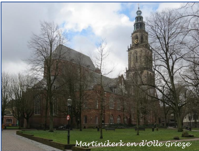
Martinikerk en d'Olle Grieze

We vinden Groningen de oude nieuwe stad geweldig, alles is op loopafstand en het openbaar vervoer is binnen handbereik met onze nieuwe Ov-kaart. De jachthaven is beschermd en heerlijk rustig ondanks dat het bijna in het centrum van de stad ligt. We voelen ons er thuis.