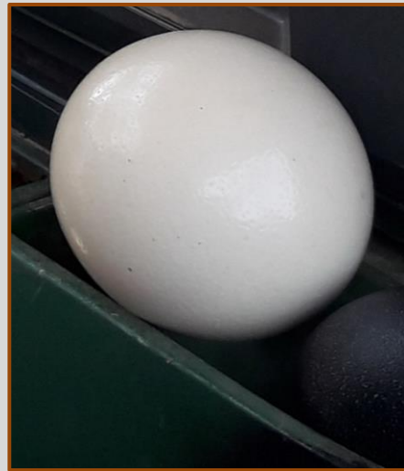
Witte en zwarte ei

De Afrikaanse legt enorme witte eieren en de Australische, kleinere pikzwarte eieren. (zie de foto) De gids waarschuwt om niet te dicht bij de omheining te komen want de vogels vinden dat niet altijd prettig en worden dan agressief. De zeelui luisteren erg goed naar dit advies en blijven lekker in de bus zitten. Nog even iets meer info;