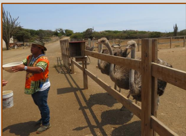
De gids heeft het voer in de aanbieding

Verder langs de route stoppen ze nog om struisvogels te voeren. Dit zijn de jongere exemplaren en die vinden het niet erg dat steeds vreemden hen eten komen geven. De gids geeft de bak met voer aan de vrijwilliger, waarna het de bedoeling is om met de rug naar de vogels gekeerd, de bak over je schouder houdt. De vogels pikken dan gretig en met kracht in de bak voor hun hapje. Uiteraard is dit een perfect moment om foto's te maken!