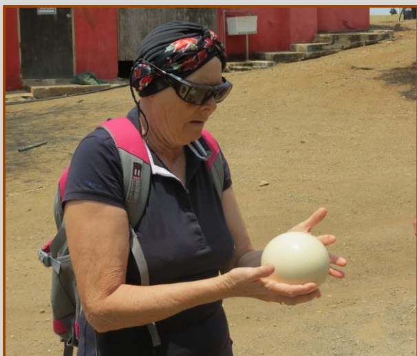
Eitje vasthouden en schudden