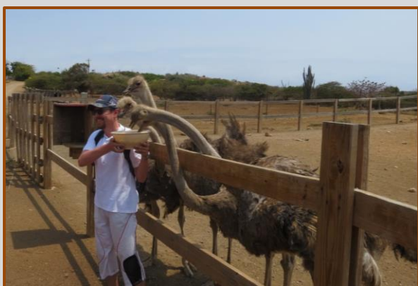
Een andere gast durft wat dichterbij te staan