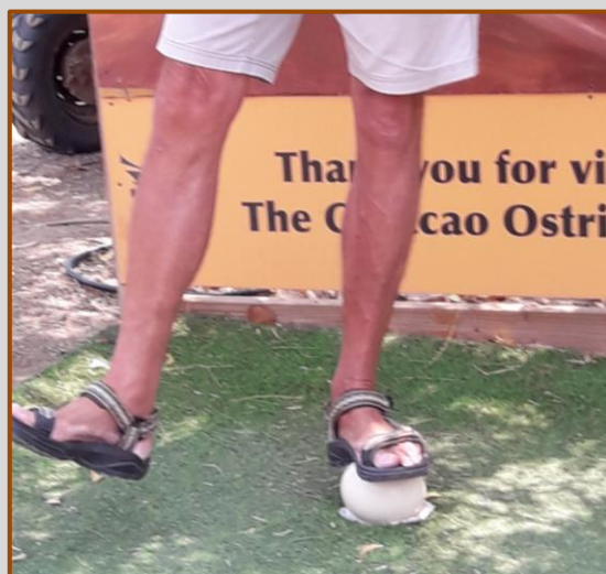
Dansen op een ei

Na de tour kunnen de Zeezwaluw'tjes nog even gezellig wandelen door een soort kleine dierentuin waarin aapjes, ganzen, pauwen en een slang, allemaal in hun eigen omheining te bezichtigen zijn. Ook aan de kinderen is gedacht want er zijn diverse speeltuin attributen om op te klauteren.