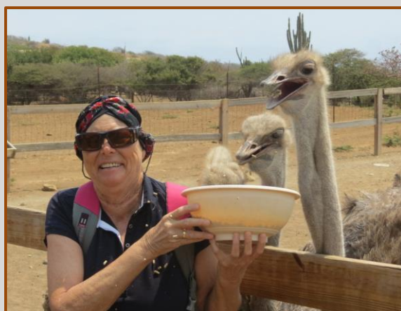
Zo moet het dus