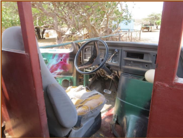
Mooie safari bus