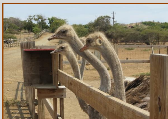
Mooie koppen in afwachting

Vlak bij de uitgang is nog zo'n fotomomentje. Er is een plek gereserveerd waar je op een heus struisvogelei kan gaan staan, die is door de vorm, onbreekbaar is. Zelfs Riens met 97kg en de Duitse toerist van XXX-kg kunnen het ei niet kapot krijgen. Het ei mag ook vastgehouden worden. Het blijkt zwaarder dan verwacht en bij het schudden voel je het echt klutsen.